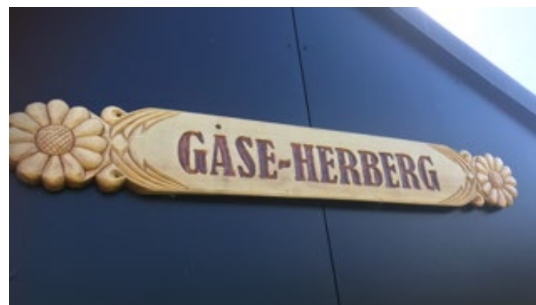
Det smukke træskilt er lavet af en af beboerne i Storbylandsbyen