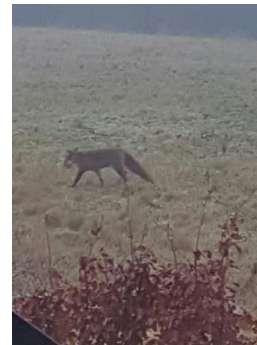
Skønt billede af ræven

Dyrelivet i og omkring Storbylandsbyen ☺☺☺