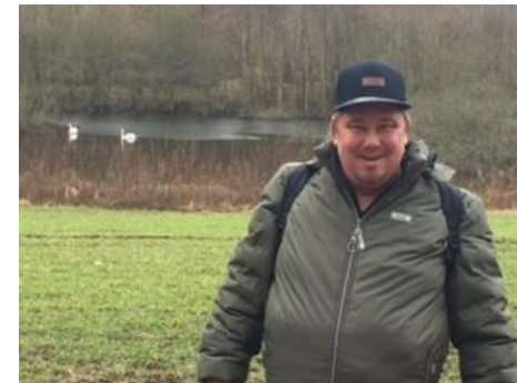
På hyggelig indkøbstur, hvor vi kunne nyde de smukke svaner i baggrunden